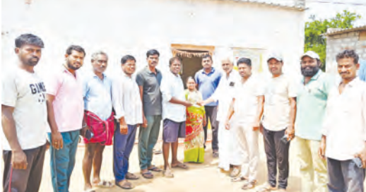
ఆర్థిక సహాయం అందజేస్తున్న పార్టీ శ్రేణులు