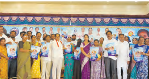
మహిళా సంఘాల సభ్యులకు చీరలను పంపిణీ చేస్తున్న దృశ్యం

కల్యుక్తి, మే 26 ప్రభాతవార్త: మహిళా సాధికారతతోనే దేశ అభివృద్ధి సాధ్యమవుతుందని, మహిళలు అన్ని రంగాల్లో ఆర్థికంగా ఎదిగేందుకు ప్రభుత్వం అవకాశాలు కృషి చేస్తుందని ఎమ్మెల్యే కనీరెడ్డి నారాయణరెడ్డి పేర్కొన్నారు. మహిళా సంఘాలను బలోపేతం చేయడానికి వడ్డీ లేని రుణాలు అందిస్తున్నారన్నారు. కల్యుక్తి పట్టణంలోని కేబిఎస్ ఫంక్షన్ హాల్ లో మున్సిపాలిటీ పరిధిలోని మహిళ సంఘం సభ్యులకు చీరల పంపిణీ కార్యక్రమానికి ఎమ్మెల్యే కనీరెడ్డి నారాయణరెడ్డి ముఖ్య అతిథిగా హాజరయ్యారు. ఈ సందర్భంగా ఎమ్మెల్యే మాట్లాడుతూ ప్రజా పాలన ప్రగతి ప్రణాళిక 99లో భాగంగా మంగళవారం మహిళ ఉత్సవాల సందర్భంగా చీరల పంపిణీ