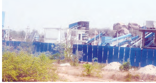
క్రషర్ మిషన్ నడుపుతున్న యజమానుల

నవాబపేట, మే 26 ప్రభాతవార్త : మహబూబ్ నగర్ జిల్లా నవాబపేట మండల పరిధిలోని చౌడూర్ గ్రామ పరిధిలో వెలసిన క్రషర్ వెంటనే నిలిపేయాలని క్రషరవారం గ్రామస్థులు అందోళన చేపట్టి క్రషర్ యజమానికి వందాయతీ సెక్రటరీ గ్రామస్థులు సర్పంచ్ నోటీసులు జారీ చేశారు. ఆదేశాలిచ్చిన క్రషర్ వసలు ఆపకుండా భారీ శబ్దాలతో బ్లాస్టింగులు చేపట్టడంతో అధికారులపై ఆగ్రహం వ్యక్తం చేస్తున్నారు. నవాబపేట కొండూరు మెయిన్ రోడ్డు రహదారి పక్కనే ఉన్న క్రషర్ ఈ ప్రాంతంలో మొక్కలు నాటి కాలుష్యాన్ని నియంత్రించాలనే నిబంధనలు ఉన్నాయి. కోర్టు వసలు జరగకుండా ఆదేశాలు ఇచ్చినా కోర్టు ఆదేశాలను ధిక్కరించి భారీ బ్లాస్టింగులు నిర్వహిస్తూ ప్రజల జీవనోపాధిపై క్రషర్ మిషన్ దెబ్బ కొడుతుందని గ్రామస్థులు రైతులు వాపోతున్నారు. ఆదేశాల్లో ఈ ప్రాంతంలో కాలుష్యాన్ని కొలిచే యంత్రాలను ఏర్పాటు చేసి, దుమ్ము ధూళి రాకుండా ఎప్పుడు సీటిని వెనజల్లేలా దుమ్ము గాలిలోకి లేవకుండా క్రషర్ ప్రత్యేక ఏర్పాటు చేసుకోవాల్సి ఉంటుంది. కానీ నవాబపేట మండలంలో కొంతమంది క్రషర్ నిర్వాహకులు నిబంధనలను గాలికి పదిలేసి ఆక్రమంగా బ్లాస్టింగ్ లు చేయడం వల్ల చౌడూరు గ్రామం మట్టుపక్క రోడ్డులో దుమ్ము ధూళి అవ హించటం వలన శబ్దం రావడంతో, ఇండ్ల కదిలి శిథిలా వ్యవస్థకు చేరుకుంటున్నాయన్నారు. కచ్చితంగా తీవ్రమైన ఇబ్బందులు పడుతున్నాయని నిబంధిత క్రషర్ యజమానులు పైన నిబంధిత అధికారుల చర్యలు తీసుకోవాలని తమను, తమ గ్రామాన్ని సమస్యను క్రషర్ ఆపాలని నోటీసులు జారీ చేశారు.