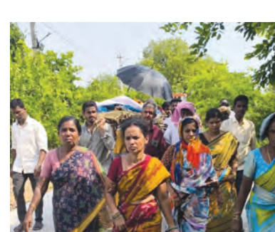
అంత్యక్రియలు నిర్వహిస్తున్న కూతుళ్లు