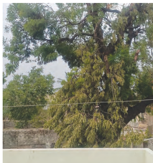
కంసానిపల్లి లో చెట్టు విరిగి ఇండ్లపై పడిన దృశ్యం

అత్యుక్త మే 26 ప్రభాతవార్త: గత గురువారం సాయంత్రం జరిగిన వివేకతో కంసాని పల్లిలో నెలకొన్న వివేక పట్ల నేటికీ ప్రజలు కోట్లాదివేలం విధులగా ఉంది. గ్రామంలో ఇంత వివేక నెలకొన్నప్పటికీ పంచాయతీరాజ్ అధికారులు అడ్రస్ లేకుండా పోవడం ఎంతవరకు సమంజసమని గ్రామస్థులు వాపోతున్నారు. గత ఆరు రోజులు నుంచి గ్రామంలో వివేక అంతరాయం ఏర్పడడంతో తాగునీరు లేక ప్రజలు తల్లిబిల్లుతున్న స్థానిక పంచాయతీ అధికారి పూర్తిస్థాయిలో నిర్లక్ష్యంగా వ్యవహరిస్తున్నారని గ్రామస్థులు వాపోయారు. గ్రామంలో వివేక సరఫరా లో నెలకొన్న సమస్య నేటికీ పరిష్కారం కాకపోవడం, తోడుగా తాగునీరు లేక ప్రజలు ఇతరప్రాంతాలకు వెళ్ళవలసిన పరిస్థితి నెలకొంది వాపోతున్నారు. గ్రామంలో నెలకొన్న వివేక సమయంలో పంచాయతీరాజ్ అధికారులు పట్టించుకోకపోవడం ఎంతవరకు సమంజసం అని గ్రామస్థులు ప్రశ్నిస్తున్నారు. గ్రామంలో పలువీధుల్లో చెట్లు విరిగి నేలకొరిగి ఎప్పుడైతే ఎం జరుగుతుందో అని ప్రజలు భయాన్ని గుప్పిస్తూ పెట్టుకొని కొనసాగుతున్నారు. ప్రమాదమని తెలిసినా అధికారులు పట్టించుకోకపోవడం చాలా విధులగా ఉందని గ్రామస్థులు ఆవేదన వ్యక్తం చేస్తున్నారు. గ్రామంలో ఉన్న చెట్లు బిగి ఇండ్లపై పడి ఉండడం వాటిని తొలగించే వారు లేకపోవడం చాలా ఇబ్బందిగా మారినా కాలనీవారులు వాపోతున్నారు. కొన్ని ఇళ్ళ ముందు వేపచెట్టు విరిగి ఇండ్లపై పడి కొట్టుమిట్టాడుతున్న చూసి చూడనట్లు వ్యవహరిస్తున్న తీరు మరి బాధాకరంగా ఉందని గ్రామస్థులు వాపోతున్నారు. ఇప్పటికైనా పంచాయతీరాజ్ అధికారులు ప్రత్యేక చర్య తీసుకొని