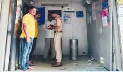
విచారణ చేస్తున్న పోలీసులు

మహబూబ్ నగర్ క్రైమ్, మే 26 ప్రభాతవార్త : మండలం ఏటీఎన్ఎ ఎత్తుకెళ్లిన ఘటన మహబూబ్ నగర్ జిల్లా కేంద్రంలో చోటు చేసుకున్నది. మహబూబ్ నగర్ జిల్లా కేంద్రంలోని తెలంగాణ చౌరస్తా వద్ద సోమవారం ఆర్డరా త్రి స్టేట్ బ్యాంక్ ఆఫ్ ఇండియా ఏటీఎమ్ ను దగ్ధం చేసి గుర్తుతెలియని దుండగులు మె పిన్ ను ఎత్తుకెళ్లారు. సీసీ కెమెరాలు కూడా దగ్ధం చేయడంతో ఎలాంటి ఆనవాళ్లు దొరకలేదు. మంగళవారం ఉదయం విషయం తెలుసుకున్న పోలీసు అధికారులు ఘటనా స్థలానికి వెళుతున్నారు. మహబూబ్ నగర్