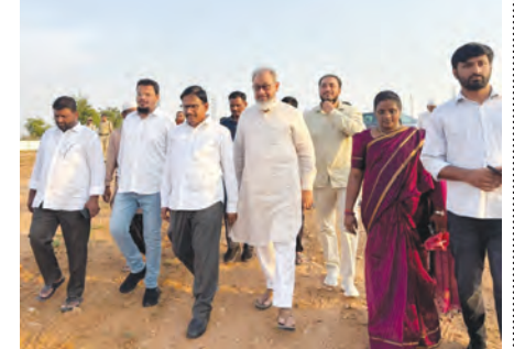
ఈ ధాన్య ప్రహారీ