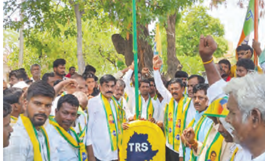
తెలంగాణ రక్షణ సేన జెండాను ఆవిష్కరించిన నాయకులు