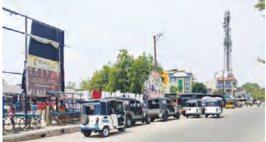
జాతీయ రహదారి 167పై బస్సు

మక్తల్ టౌన్, మే 26 ప్రభాతవార్త: మక్తల్ పట్టణంలో ట్రాఫిక్ సమస్య రోజురోజుకూ తీవ్రరూపం దాల్చుతోంది. ఆదివారం అందగి ఉండటంతో సంతభజారు మెయిన్ రోడ్డు, మార్కెట్ సెంటర్ లో ఉదయం 9 నుంచి రాత్రి 8 వరకు వాహనాలు కిక్కిరిసి పోయి నడవడానికి కూడా స్థలం లేకుండా పోతోంది. సొంత బజారు రోడ్డు ఇరువైపులా పావుల ముందు వందలాది ట్రైలర్లు, న్యూటన్లు, ఆటోలు, కార్లు ఇన్సూసారం పార్కు చేస్తున్నారు. రోడ్డు పై ఏదైనా ఒక వాహనాన్ని దుకాణదారులు అడ్డం కొరకు నిలిపి వేయడంతో ట్రాఫిక్ పూర్తిగా స్తంభించిపోతోంది. మహిళలు, చిన్నారులు వాహనాల వాపుల నుంచి తప్పించుకుంటూ ప్రాణాలు అరచేతలో పెట్టుకుని వెళ్తున్నారు. ఈ దారిలో అంబులెన్స్ వచ్చే కూడా దారి ఇచ్చే పరిస్థితి అసలే లేదు. గతంలో గుండెపోటు రోగిని తీసుకెళ్తున్న అంబులెన్స్ 15 నిమిషాలు ఇక్కడే