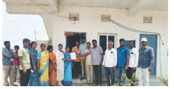
వినతి పత్రం సమర్పించిన గ్రామస్థులు

మట్టుపక్కల ఉన్న పొలాలు కూడా పంటలు దెబ్బతింటున్నాయని గ్రామస్థులు ఆరోపిస్తున్నారు. నిబంధనలను పట్టించుకోకుండా నిర్వహిస్తున్న క్రషర్లను వెంటనే సీజ్ చేసి ప్రభుత్వ సంపదను రావాల్సి కోట్లరూపాయల సంపదను ఆవిరి చేస్తున్నారని వాపోతున్నారు. క్రషర్ యజమానులపై చర్యలు తీసుకోండిమండలంలోని చౌడూరు గ్రామపంచాయతీ పరిధిలోని క్రషర్ లో భారీగా బ్లాస్టింగ్ జరుగుతున్నాయని తాము దుమ్ము ధూళికి అక్కడ ఉండలేక పోతున్నామని మట్టుపక్కల గ్రామాల రైతులు ఆరోపిస్తున్నారు. బ్లాస్టింగ్ జరిగిన ప్రతిసారి గ్రామంలోని అన్ని నివాస గృహాలు కాలుష్యంతో దుమ్ము, ధూళితో నిండిపోవడమే కాకుండా, పెద్ద శబ్దం రావడంతో, ఇండ్ల కదిలి శిథిలా వ్యవస్థకు చేరుకుంటున్నాయన్నారు. కచ్చితంగా తీవ్రమైన ఇబ్బందులు పడుతున్నాయని నిబంధిత క్రషర్ యజమానులు పైన నిబంధిత అధికారుల చర్యలు తీసుకోవాలని తమను, తమ గ్రామాన్ని సమస్యను క్రషర్ ఆపాలని నోటీసులు జారీ చేశారు.