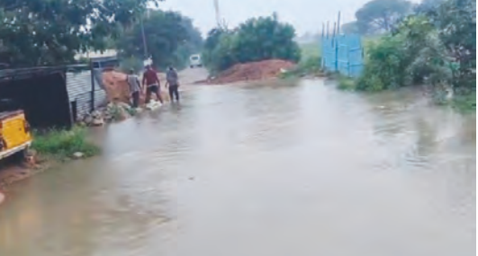
గతేడాది వర్షాకాలంలో వచ్చిన వరదలు, ఇబ్బంది పడ్డ ప్రజలు (ఫోటో)

అవి నేటికీ కూడా అధికారులు గానీ నాయకులు గానీ చెరువు అలుగు కల్వర్షు కోసం ప్రతిపాదనలు అందించడం లేదని ఆధికారులు గ్రహించడం లేదని అటువైపు చూడటం లేదని వాపోతున్నారు. వర్షాకాలం సమీపిస్తున్నా కల్వర్షుల నిర్మాణానికి నోచుకోవాలి. ప్రస్తుత ఎమ్మెల్యే అనిరుద్ రెడ్డి దృష్టికి సమస్యను తీసుకువెళ్లే త్వరితగతిన ప్రజల సమస్యలు వెనక్కించడానికి ఎమ్మెల్యే అనిరుద్ రెడ్డి బోధన చూపుతాడని వెంటనే సమస్యలు కల్వర్షుల పరిష్కారం అవుతాయని ప్రజలు నాయకులు మాట్లాడితే