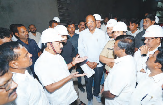
పాలమూరు రంగారెడ్డి ప్రాజెక్టు అధికారులతో మాట్లాడుతున్న మంత్రి జాపల్లి

పట్ల కూడా గత ప్రభుత్వం నిరక్షణంగా వ్యవహరించినందుకు మంత్రి విమర్శించారు. ఈ ప్రాజెక్టు కింద ఉన్న రిజర్వాయర్ల సామర్థ్యం కేవలం 4 టీఎంసీలే ఉండటం వల్ల 40 వేల ఎకరాలకు మించి నీరందే అవకాశం లేదని, 4.50 లక్షల ఎకరాల ఆయకట్టుకు నీరందాలంటే కనీసం 25 టీఎంసీల సామర్థ్యం ఉండాలని ఆయన స్పష్టం చేశారు. కానీ బీఆర్ఎస్ పాలకులు ఒక్క రిజర్వాయర్ను కూడా పూర్తి చేయలేదని ఆరోపించారు. జూరాల ప్రాజెక్టు, నెట్టెంపాడు, భీమా, కోయిలా సాగర్ వంటి ప్రాజెక్టులకు కూడా సరైన నీటి నిల్వ సామర్థ్యం లేకపోవడంతో జిల్లా రైతాంగం తీవ్ర ఇబ్బందులు పడుతోందని, పాలమూరు ప్రాజెక్టులను విస్తరించి ఇతర ప్రాంతాల ప్రాజెక్టులపైనే ఆ ప్రభుత్వం దృష్టి పెట్టడం మంత్రి విమర్శించారు. ఈ సందర్భంలోనే సీఎం రేవంత్ రెడ్డి వచ్చే వారంలో జిల్లాలో పర్యటిస్తే ప్రాజెక్టుల పరిస్థితులను స్వయంగా సమీక్షిస్తారని మంత్రి తెలిపారు. మహాత్మాగాంధీ కల్యాణ కమిటీ అధికారం ద్వారా అప్పుపేట, వనపర్తి, కల్వకుర్తి, కొల్లాపూర్ నియోజకవర్గాల్లోని బివరి ఆయకట్టు వరకు నీరందించడమే తమ ప్రభుత్వ డ్యేయమని మంత్రి ఉద్ఘాటించారు. ఈ ప్రాజెక్టు ద్వారా 4.60 లక్షల ఎకరాలకు 4,600 క్యూసెక్కుల నీటిని తరలించేందుకు ఎల్లూరు, సింగం, గుడిపల్లి వరకు మట్టికట్టలను సరిచేయాల్సి ఉందని ఆయన చెప్పారు. రైతాంగానికి నీటి ఇబ్బందులు లేకుండా శాశ్వత పరిష్కారాలు చూపుతామని, పాలమూరు రంగారెడ్డి ప్రాజెక్టు 3 పెండింగ్ పనులన్నీ పూర్తి చేస్తామని మంత్రి జాపల్లి కృష్ణారావు ప్రకటించారు.