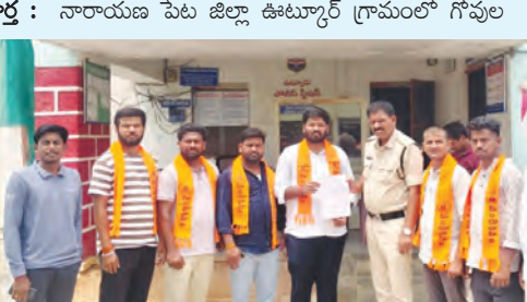
వినతి తీర్చే సమర్థిస్తున్న హిందూవాహిని సభ్యులు